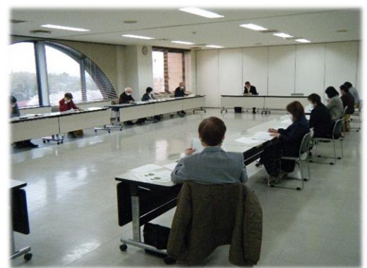
水道事業運営審議会の様子

水道事業運営審議会は、公募による市民、学識経験者および水道使用者で構成されています。