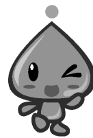
マスコット キャラクター 「みず坊」

「安全でおいしい 久喜の水」は、地下約270メートルの水脈から汲み上げた清らかで安定した深井戸水をボトリングしたものです。是非ご賞味くださいね！