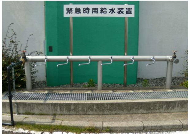
上下水道部 水道施設