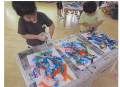
色紙をちぎって、水を吹きかけた。 紙に素敵な色が着いたよ！