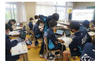
「探究的な学び」の実現に向けた複線型の授業