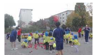
地域交流祭の様子