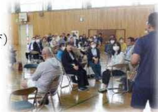
コミュニティスクール会議