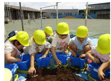
みんなで種まきしたよ。大きくなる の楽しみだね。どんな野菜かな。いつ 食べられるかな。楽しみだね。