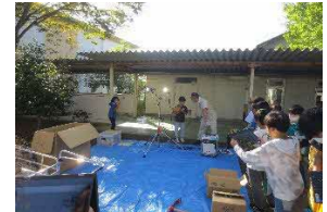
5年ペガサスタイム （総合的な学習の時間） 「防災学習」