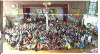
子供が主役！地域や保護者の方と共に「幸せを創るお祭り」の開催