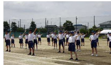
縦割りの団で3年生がリーダーシップをとる体育祭

＜本年度の重点＞①学力向上 ②不登校0をめざす ③働き方改革 ④豊かな人間性の育成 ⑤家庭・地域との連携