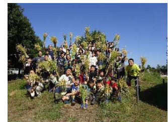
地域の人と稲刈り体験