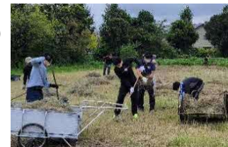
生徒・保護者・地域の方々で行う「ふれあい除草」