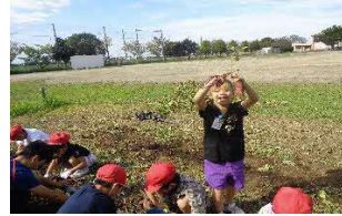
1年ペガサスタイム （生活科） 「さつまいもほり」