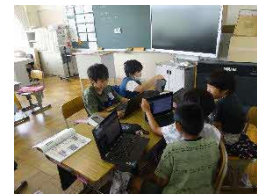
個別最適・協働的な学び