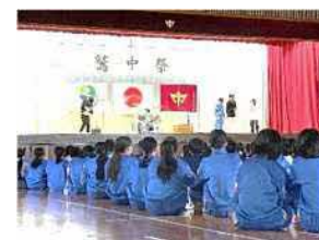
鷺中祭【有志の出しもの】

＜各学年目標＞ 1年「原点」2年「飛躍」3年「羽ばたく青春」 5・6・7組「自立」