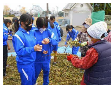
地域の方との大豆の殻むき