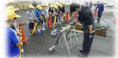
地域とともに考える「生きる教育の日」