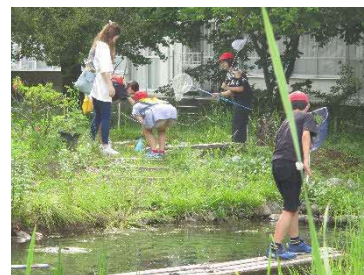
久喜市内で一番広いビオトープの自然観察会