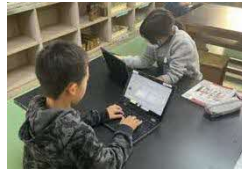
探究的な学び・複線型の授業