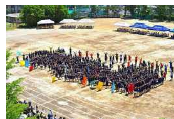
体育祭での全校写真