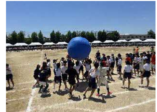
【生徒主体で行う体育祭の様子】