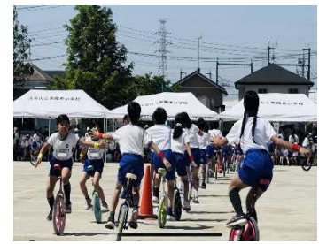
3年生から練習し運動会で成果 を披露した4年生の一輪車演技