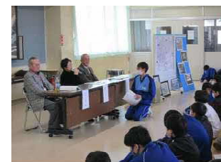
カスリーン台風から学ぶ