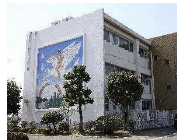
学校のシンボル ペガサス