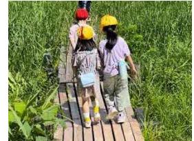
自然豊かな環境での学習