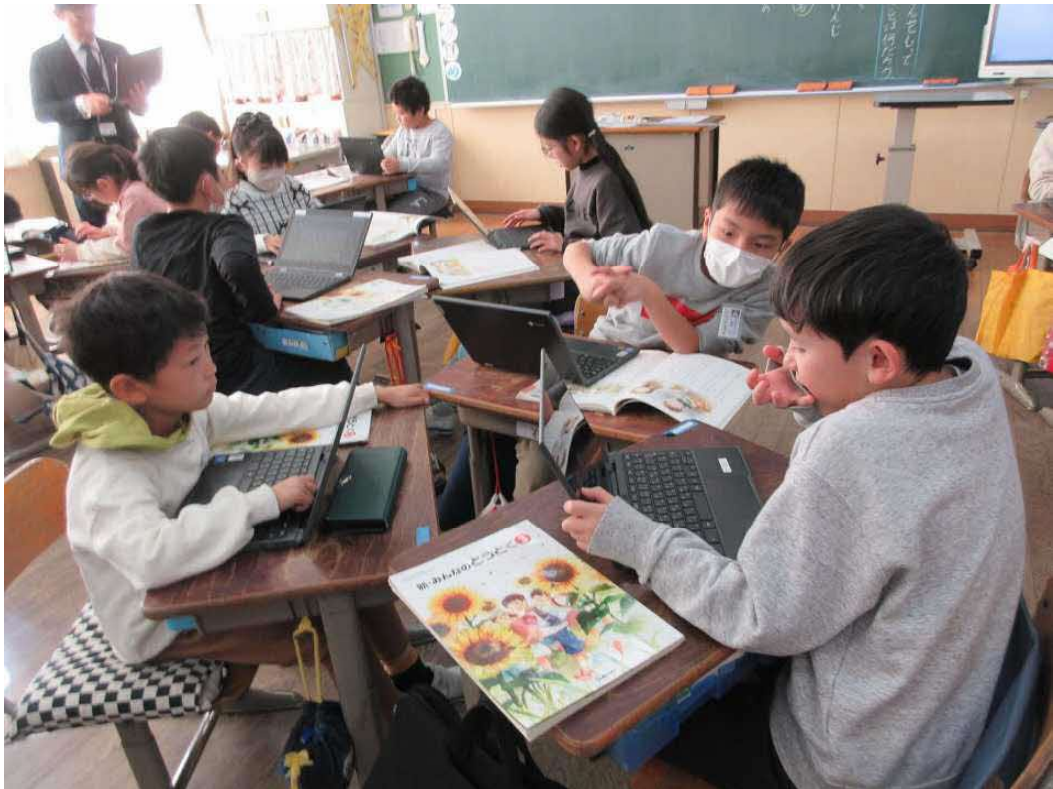
協働的な学びの推進 (久喜北小学校)