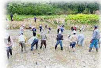
赤倉自然体験教室「田植え」