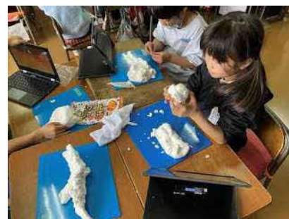
教科横断的な STEAM 教育の推進 2 年生 国語×図工