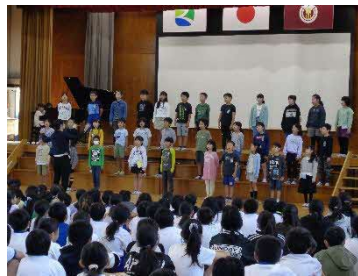
体育館いっぱい美しい 音楽が響いた校内音楽会