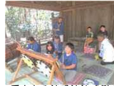
歴史ある神明神社「例大祭」にて、子供達が学校で学んだ栢間囃子を披露