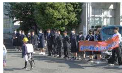
あいさつ運動の様子 (栗橋南小学校校門)