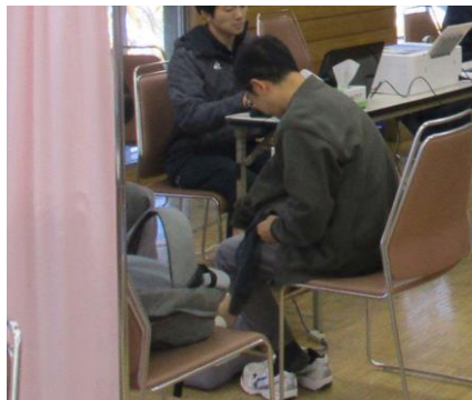
◎ スライムづくり : 株式会社セキ薬品