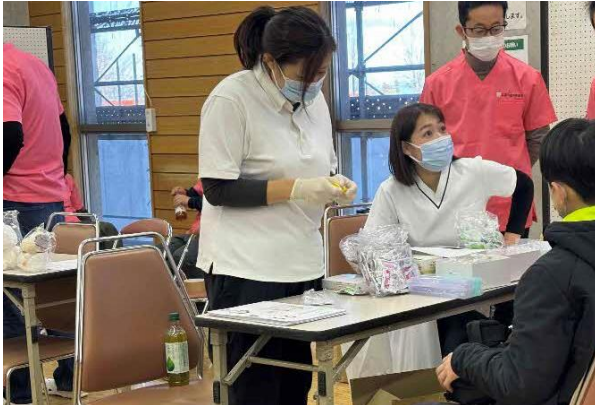
◎ 口を閉じる力の測定：久喜市歯科医師会