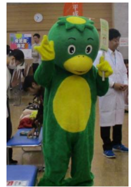
◎ 消防服着装／救命体験(AED 体験、応急処置)：埼玉東部消防組合久喜消防署