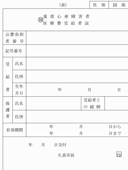
様式第2号の2(第4条関係)