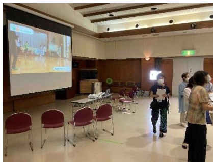
▲スライド上映による団体活動発表