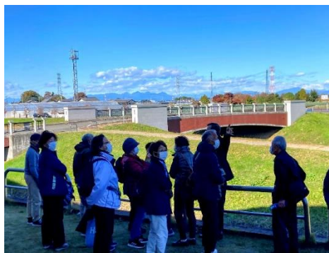
▲渋沢栄一の出生地 深谷市