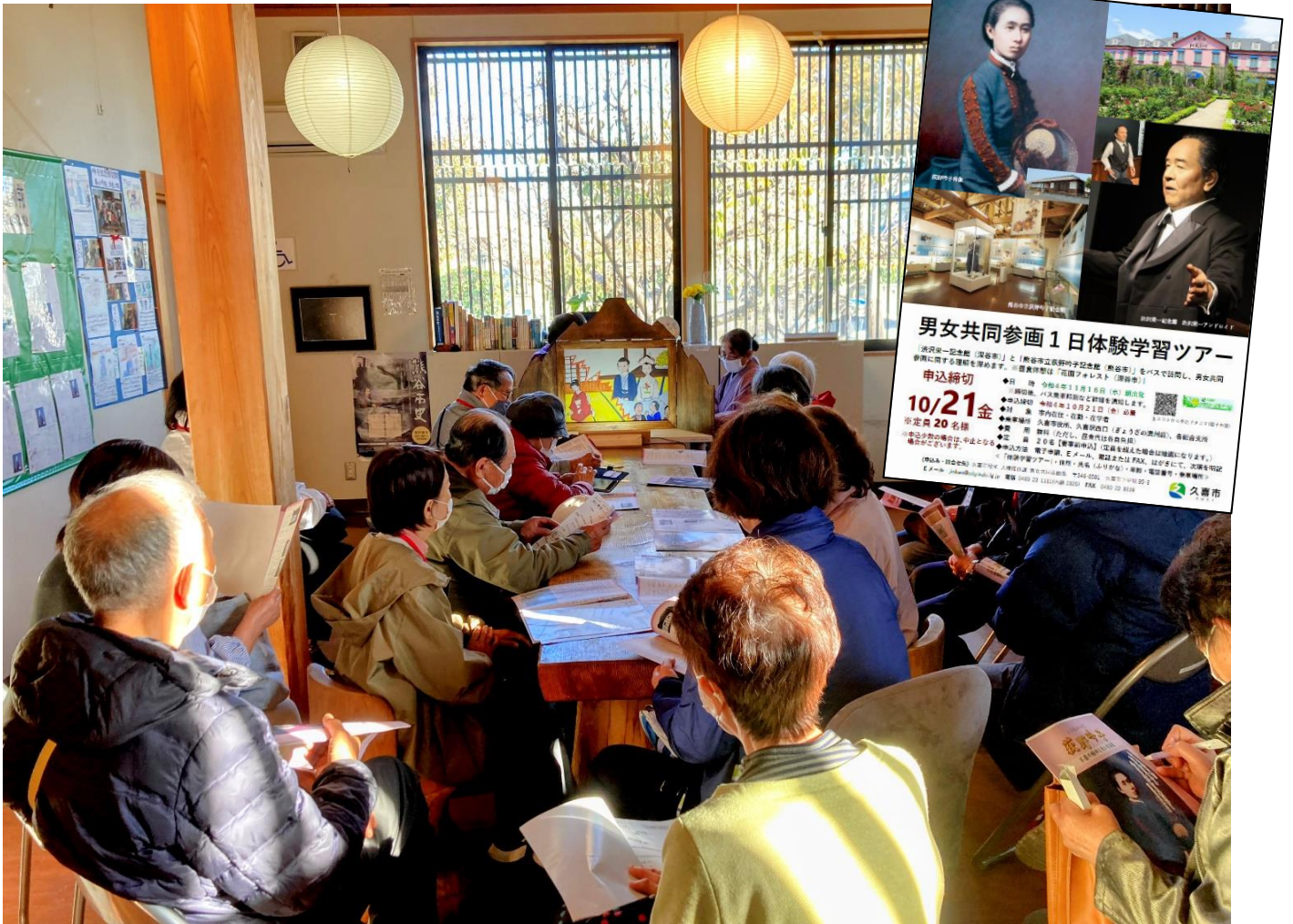
▲熊谷市立荻野吟子記念館 紙芝居「荻野吟子の一生」