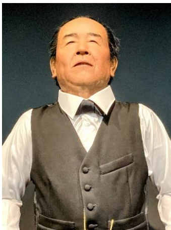
▲渋沢栄一アンドロイド