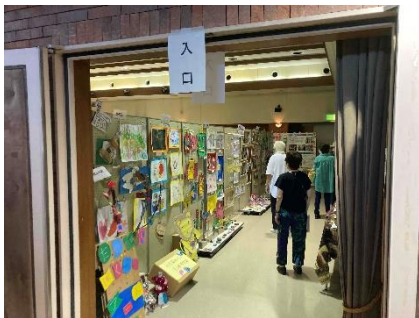
▲女と男いきいきネットワーク久喜による展示会