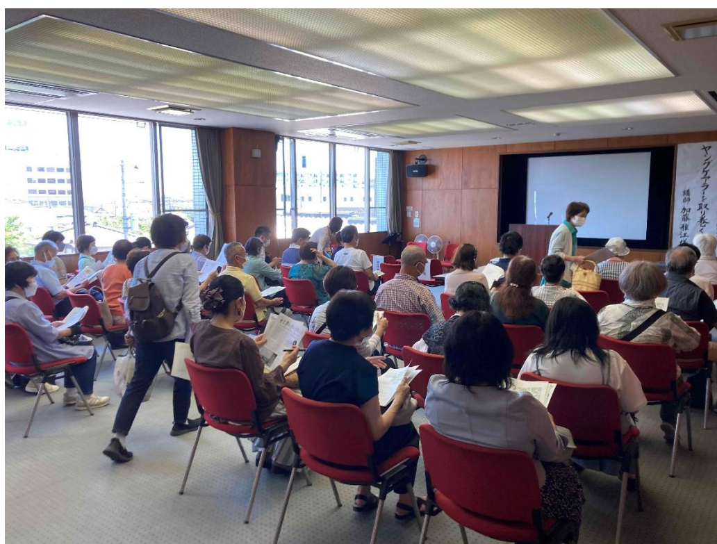
▲令和4年度 男と女のつどい