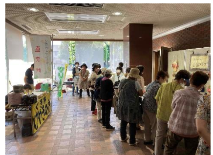
▲物品販売コーナー

令和4年6月25日(土)、「令和4年度男と女のつどい」が開催され、168名の方にご参加いただきました。