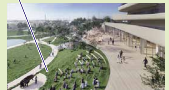
▲ 大階段ステージ・テラス