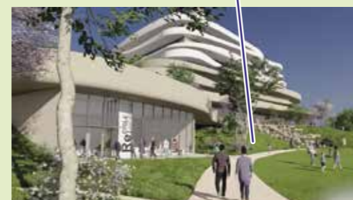
▲ 散策路からの眺め