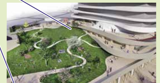
▲ 屋上庭園（屋上緑化）