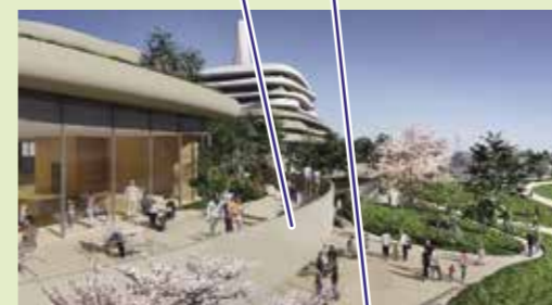
▲ 管理棟からの眺め