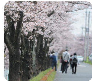
桜(南栗橋スポーツ広場付近)