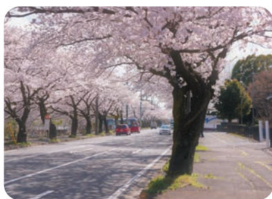
桜 (清久さくら通り)