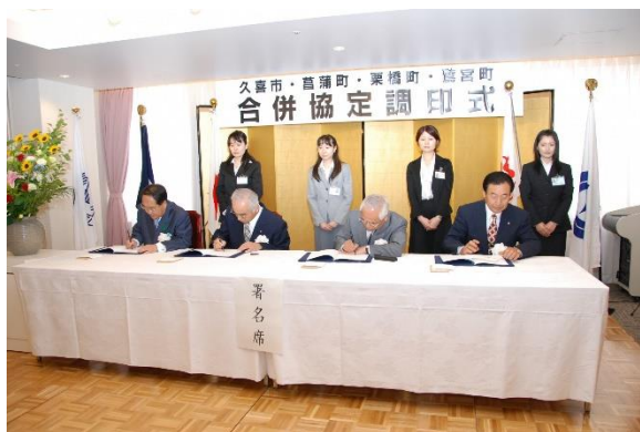
合併協定調印式 平成21年5月