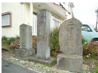
①-2 木造釈迦如来坐像 (非公開)