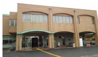
久喜市立郷土資料館