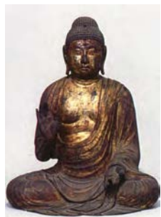
①-2 木造釈迦如来坐像 (非公開)