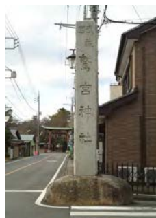
鷺宮神社の社号標