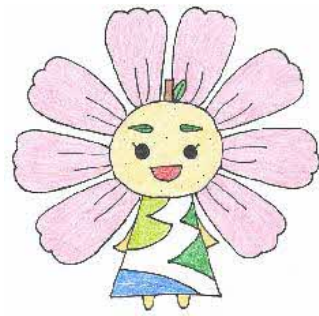
久喜市内小・中学校 マスコットキャラクター 「はぴるん」