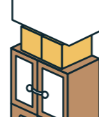
・段ポールなど 身近なもの