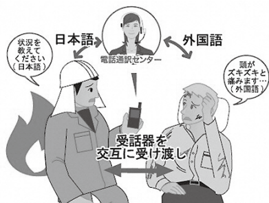
▲災害現場活動時【二者間通話】