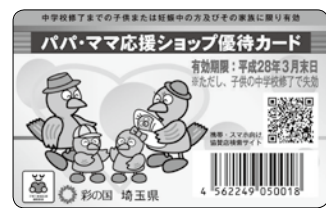
新しいパパ・ママ応援シヨップ優待カード