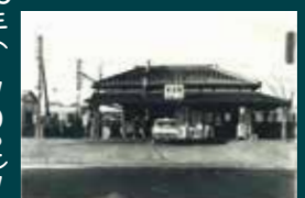
昔の鷺宮駅舎 (昭和47年撮影)

今から126年前の明治32年(1899)に東武鉄道の北千住～久喜間が開業しました。その3年後の明治35年(1902)9月に、久喜・加須間の鉄道建設に伴って鷺宮駅が設置されました。開業当日の9月6日には、久喜・鷺宮・加須の3駅(花崎駅は昭和2年(1927)開業)で開業式が行われました。式では、駅の入口に国旗が掲げられ、列車が発着する際には花火が打ち上げられました。また、音楽隊による演奏や神楽の披露、餅投げなどの催しが行われ、老若男女が仕事を休んで、駅に集まっていたと当時の新聞記事に載っています。地元の人々がいかに鉄道開通を楽しみにしていたかがわかります。