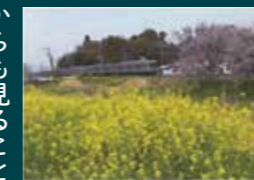
鷺宮駅西側の青毛堀川沿いに咲く桜と菜の花

鷺宮駅が開業してから8年後の明治43年(1910)の時刻表がカッコ内は現在の本数によると、上り下りとも列車が8本(平日上り59本下り60本、土休日上り58本下り60本)で、主な主要駅までの所要時間(カッコ内は現在の所要時間)は、久喜駅まで約7分(約4分)、粕壁(現春日部)駅まで約38分(約23分)、北千住駅まで約1時間30分(約40分)、浅草駅(※現とうきょうスカイツリー駅)まで約1時間50分(約1時間)でした。当時は、現在のような電車ではなく、蒸気機関車に貨車と客車を連結して走っていました。その後、伊勢崎線は、昭和2年(1927)に電化し、鷺宮駅舎も平成4年(1992)に橋上化され多くの方に利用されています。開業当時と比べて現在はかなり利便性が高くなっています。