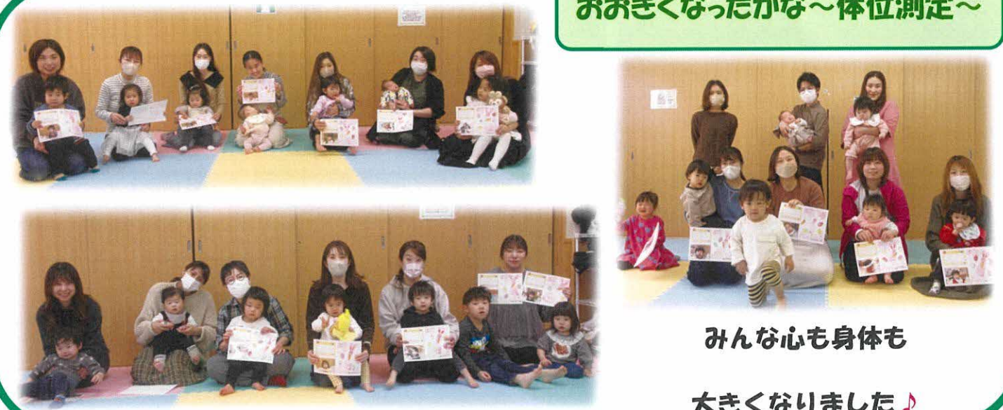
みんな心も身体も大きくなりました♪