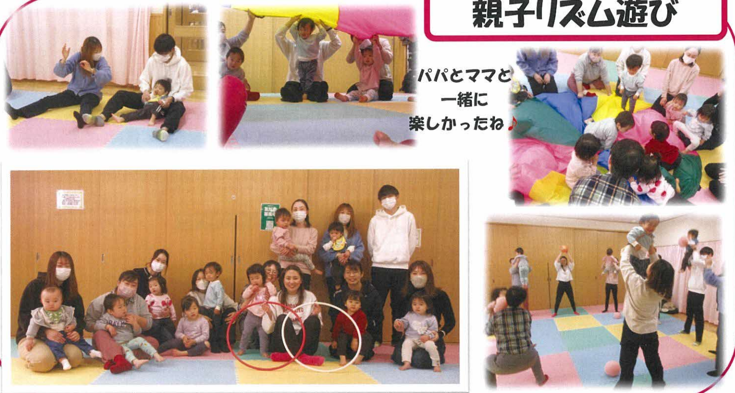
パパとママと一緒に楽しかったね！