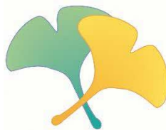
久喜市の木「イチョウ」