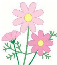
久喜市の花「コスモス」