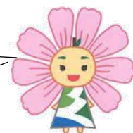
久喜市内小・中学校 マスコットキャラクター 「はびるん」

久喜市立学校給食センターでは、最大100食の食物アレルギー対応食が調理できるよ。 食物アレルギー対応食は、できる限り、見た目やおいしさ、栄養が通常の給食と同じになるように工夫しているよ。