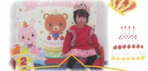
お誕生日おめでとう！！