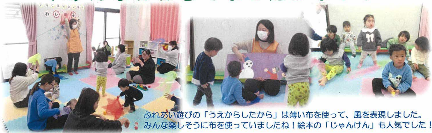
ふれあい遊びの「うえからしたから」は薄い布を使って、風を表現しました。みんな楽しそうに布を使っていましたね！絵本の「じゃんけん」も人気でした！