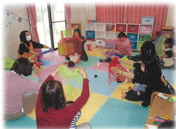
今月もたくさんのお友達に参加していただきました☆ ふれあい遊びの「うえからしたから」「ラララ右手」では、歌に合わせて楽しく遊べましたね！ ぜひお家でもやってみてくださいね！