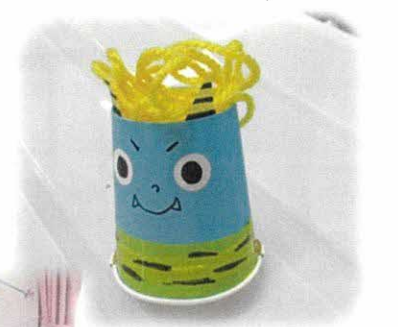
今回もたくさんのお友達が来てくれました！今回はトコトコ走る紙コップの可愛い鬼さんを作りました！製作の後は、みんなで豆まきしましたね！楽しく「おには～そと！ふくは～うち！」できました☆