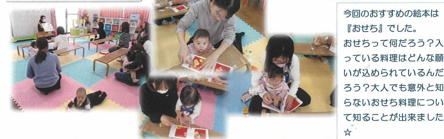
今回のおすすめの絵本は『おせち』でした。 おせちって何だろう？入っている料理はどんな願いが込められているんだろう？大人でも意外と知らないおせち料理について知ることが出来ました☆