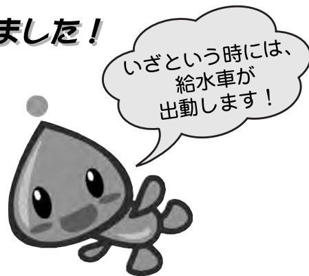
マスコットキャラクター「みず坊」