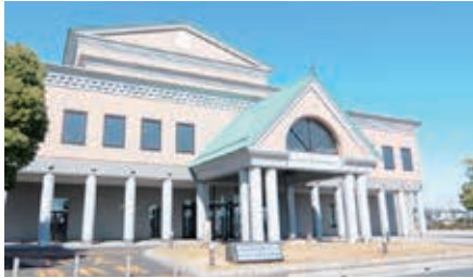
菖蒲文化会館アミーゴ

Q 菖蒲文化会館アミーゴも除却・集約化を2030～2038年に行うとなっているが、何処へ集約化されるのか説明をして欲しい。