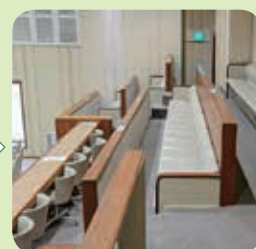
席はこんな感じニャ