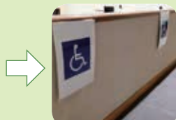
車椅子の方のスペースも