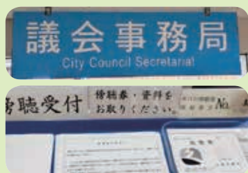
本庁舎5階の議会事務局で傍聴券と資料を受け取るニャ

久喜市議会では、本会議・一般質問・常任委員会のすべてを傍聴することができるニャ。議会を身近に感じてもらえるよう、傍聴の手順を紹介するニャ!