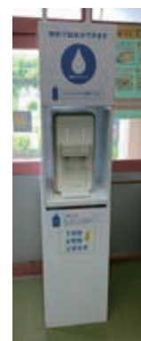
PTA会費で設置した桜田小ウォーターサーバー