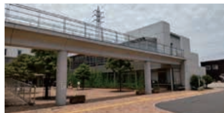
福祉サービスの拠点である ふれあいセンター久喜

A ふれあいセンター久喜の機能を廃止して久喜東複合施設は行政機能、図書館、コミュニティセンター、子育て支援を整備する計画だが、福祉的な機能を一部残したいと考えている。