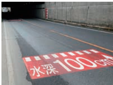
水位表示された宿地下道