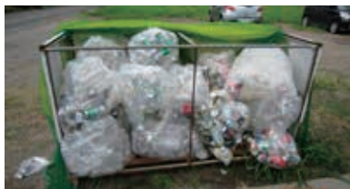
集積所がいっぱいになるビン・缶・ペットボトル