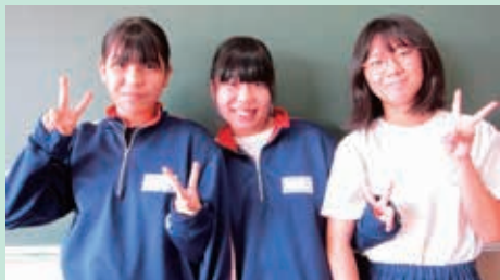
鷺宮西中学校総合文化部の皆さん

作成者の感想 久喜市は、自然豊かでお花がすごく綺麗な印象があるので、それを<ゼンタングル®>で表現してみました。そして、久喜市の皆さんが「毎日心穏やかに過ごせるように」という思いを込めて<ゼンタングル®>をベースに、冬の情景を鮮明に描きました。