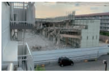
桜田での解体現場