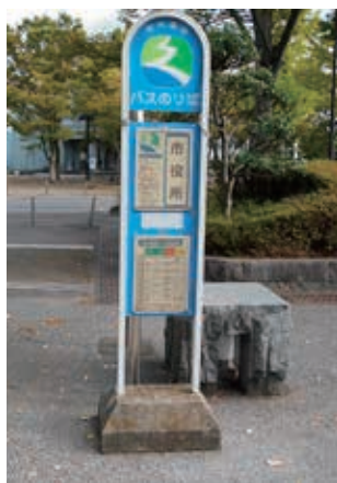
市内循環バスの停留所

Q 防災行政無線は豪雨や台風時には放送内容が室内で全く聞こえない。これは台風19号で体験済みである。そこで