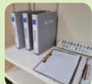
ご覧いただける資料