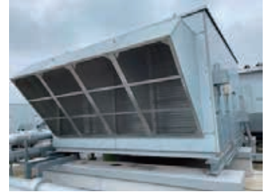
1月に凍結事故が起きた学校給食センターのエアコン

◇上清久交差点の早急な改善を◇清久小裏側市道久喜223号線、スカイハイツ脇市道久喜4093号線の凸凹改善を◇低所得者のエアコン設置に補助を◇菖蒲あやめ園の予算を拡大し継承を