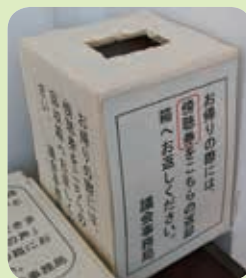
お帰りの際は傍聴券を回収箱へ(出入りは自由)

議会のスケジュールは、議会だよりの最終ページとインターネットに載ってるニャ。皆さんのお越しを待ってるニャー!