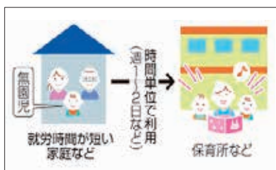
こども誰でも通園制度（仮称）イメージ

Q 親が就労していないくても子供を保育園などに預けられる取組だが、来年度の本格実施を目