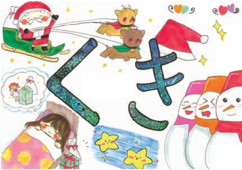
題字：鷺宮西中学校 総合文化部の皆さん