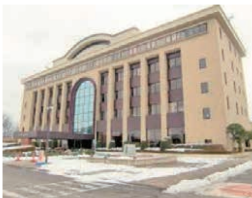
外壁改修予定の鷺宮総合支所