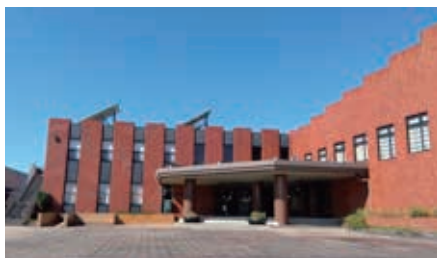
移転予定のコミュニティセンターさくら

A コミセンと隣接して整備する子育て支援施設を利用する親子との世代間交流も期待でき