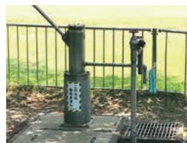
久喜市が使用しない事にした校庭の片隅にある防災井戸

A 災害時は保水水の備蓄があり協定先や国から支援もある。要水質検査など費用対効果から防災井戸の利用、災害時協力井戸の登録制度は見送る。