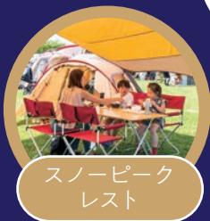
スノーピーク レスト