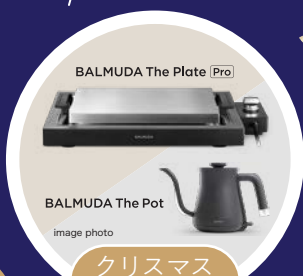
クリスマス 大抽選会