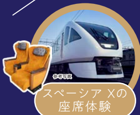
スペース Xの 座席体験