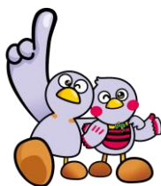
埼玉県のマスコット

※2 さいたま市、川越市、越谷市、熊谷市、川口市、所沢市、春日部市、草加市及び久喜市は各市役所へお問い合わせください