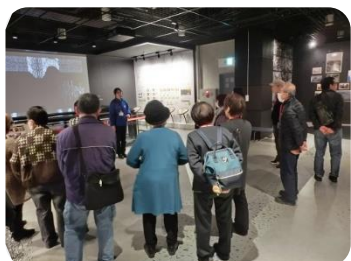
▲地震体験の説明の様子

地震体験や防風体験を通じて、防災に対する知識や行動力について身につける機会となりました。