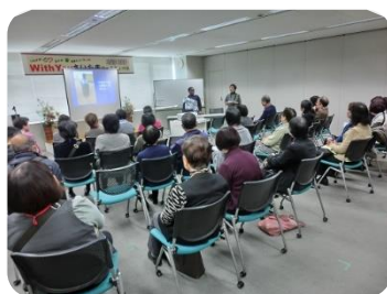
▲グループフォー発表