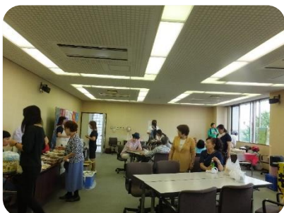
▲喫茶・販売コーナー