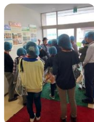
▲森永製菓のお菓子の説明