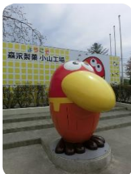
▲キョロちゃんがお出迎え