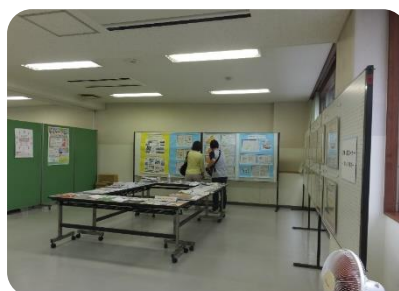
▲災害・防災コーナー