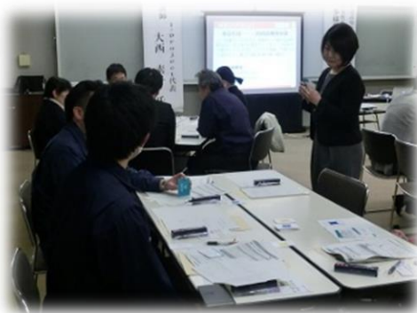
▲クロスロードゲームの様子