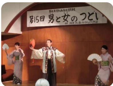
▲団体によるステージ発表