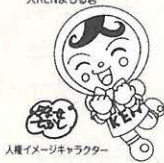
人権イメージキャラクター