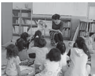
菖蒲図書館のおはなし会

おはなし会 日時 11月6日(土) 11時 場所 幼児・児童コーナー 内容 「ヤギと」オロギ」ほか 対象 幼児・児童