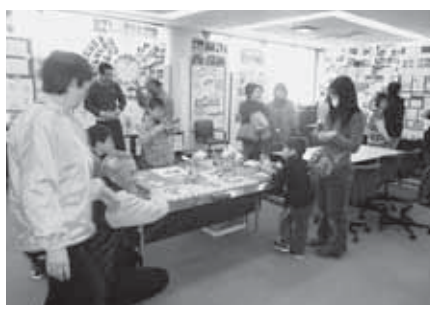
楽しい体験とふれあい

申込方法・問合せ 電話またはFAXで、生涯学習課生涯学習係(内線4281/☎21・4977)へ