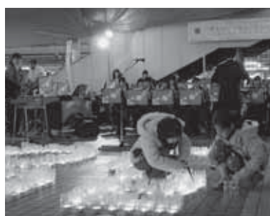
前回のキャンドルナイトの様子