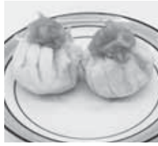
サツマイモの花かご