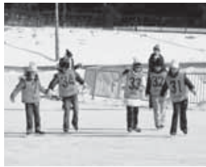
昨年のスケートのつどい

日時 平成24年1月21日(土) 7時45分栗橋B&G海洋センター集合～17時帰着予定 ※自動車を利用する場合は栗橋文化会館(イリス)舗装駐車場(同センター裏側)へ 場所 日光霧降スケートセンター(栃木県日光市所野2854番地)