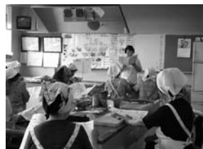
▲バランス栄養講座

“支部会員からひとこと” 「自分の健康は自分で守る」をモットーに地域の皆さんと楽しく元気よく、バランスのとれた食事づくりを通して食生活について考えていきたいです。