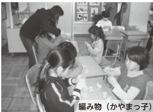
編み物 (かやまっ子)