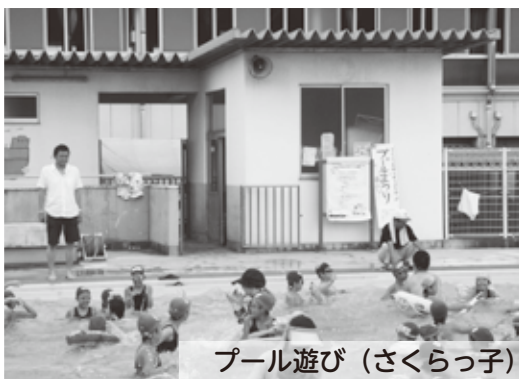
プール遊び (さくらっ子)