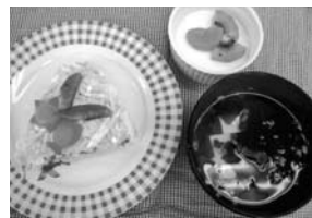
▲子どもたちと一緒に作った料理

“支部会員からひとこと” 地域の皆さんが良い食生活を身に付け、生涯健康に暮らしてもらうことを願い、日々活動しています。また、多くの皆さんと「食」について考えていきたいです。