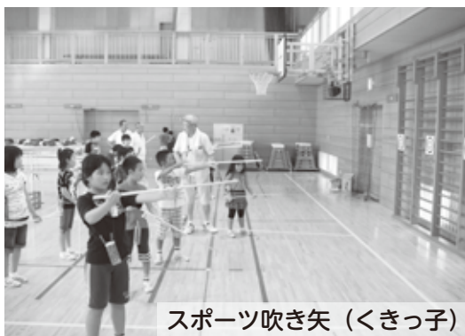
スポーツ吹き矢 (くきっ子)