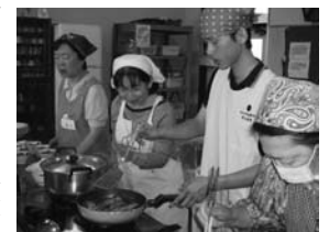
▲バランス栄養講座

“支部会員からひとこと” 私達は、いつも楽しく料理作りをしながら豊かな心と健康づくりを進めています。