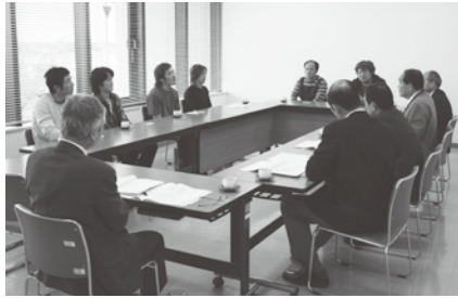
昨年菖蒲地区で開催された出前市長室の様子

菖蒲地区 日時 11月6日(火) 14時30分～16時 場所 菖蒲総合支所 応募要件 主に菖蒲地区で活動する市民団体またはグループ 応募期限 9月27日(木)