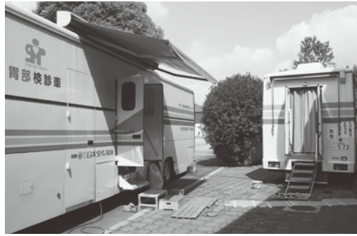
胃がん・肺がん検診車

のどちらか一方を選択して受診できます。子宮がん・大腸がん・前立腺がん検診、肝炎ウイルス検診は、集団検診または個別検診のどちらか一方を選択して受診してください。