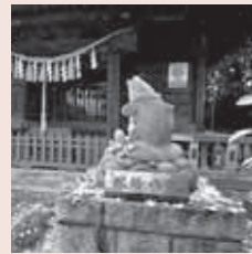
八坂神社の招福乃鯉

栗橋地区の鎮守である八坂神社には、対になった鯉の像があります。拝殿前にあるこの像は、昭和61年に設置されたもので、口元を見ると阿吽の像のごとく、口を大きく開いた鯉(招福乃鯉)と、口をぎゅつと結んだ鯉(除災乃鯉)で対になっています。また、この像をよく見ると、鯉が浮かぶ波間に魚も彫り込まれていることが分かります。これは八坂神社が次のような縁起に由来したものとされています。