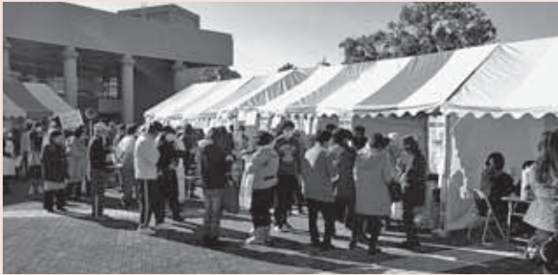
▲久喜総合文化会館ふれあい広場でのまつりの様子

平成26年12月14日(日)、久喜総合文化会館で、「久喜市健康・食育まつり」が開催されました。