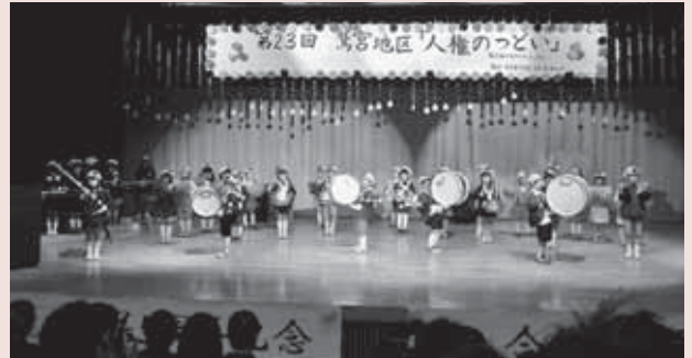
▲鷺宮保育園・鷺宮第二保育園による合奏