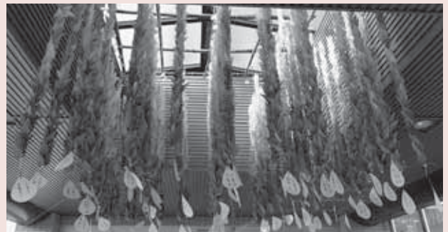
▲被災地への願いを込めた折鶴

平成26年12月13日(土)、鷺宮西コミュニティセンター(おおとり)で、第23回鷺宮地区「人権のつどい」が開催されました。