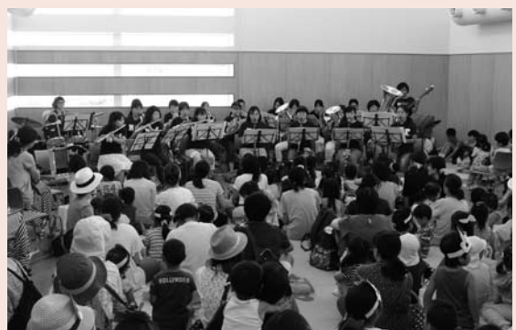
▲ミニコンサートの様子

8月6日(木)、栗橋コミュニティセンター（くぶる）で、「第3回親子で楽しむ ファミサポ祭り」が行われました。