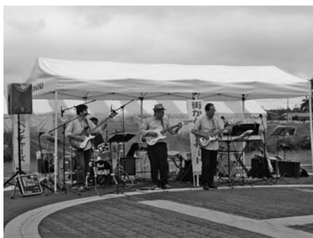
▲第3回街かどコンサートの様子(菖蒲地区)

夏の終わりに、秋の気配を感じながら懐かしの曲を聴いてみませんか。皆さんのご来場をお待ちしています。