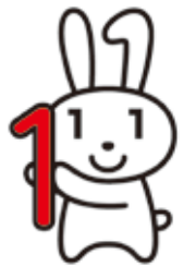
マイナンバー広報キャラクター「マイナちゃん」

① 社会保障（年金・労働・福祉・医療など） 年金の資格取得や確認・給付、雇用の資格取得や確認、ハローワークの事務、医療保険の保険料徴収、福祉分野の給付、生活保護など