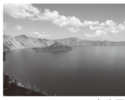
▲クレーターレイク国立公園