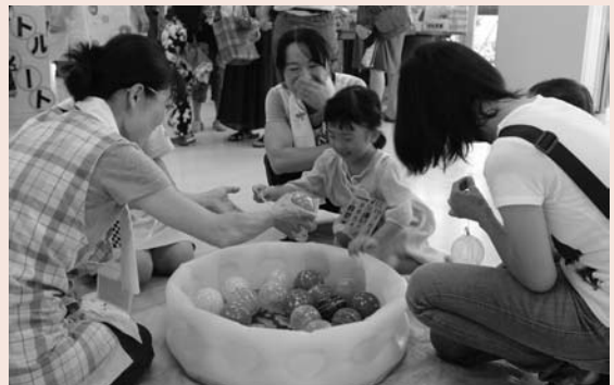
▲ヨーヨー釣りの様子