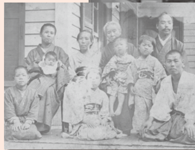
▲本多家家族写真（後列左端が銚子、後列右端が静六）