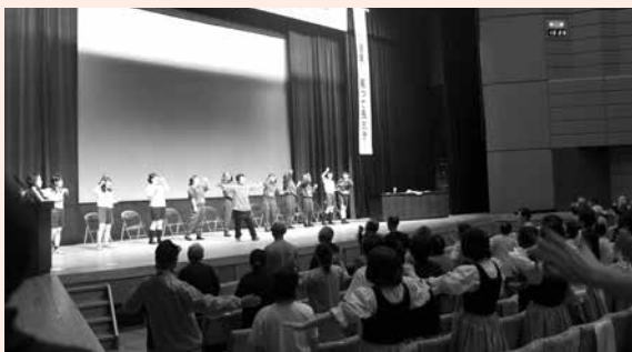
▲講演で来場者もラフターヨガを体験