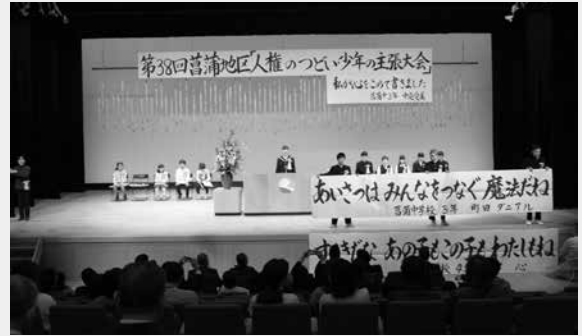
▲人権標語発表の様子