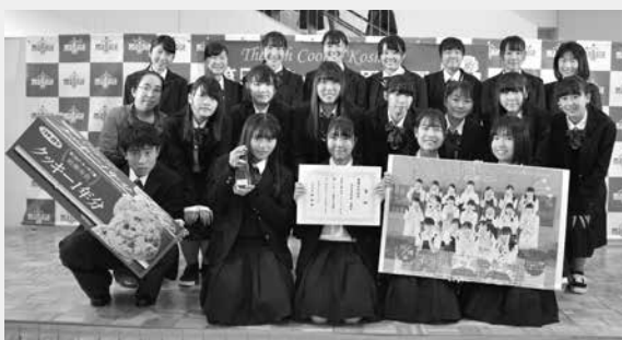
▲最優秀作品賞に喜ぶ県立鷺宮高等学校調理部の皆さん