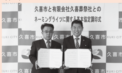
11月21日(水)、市は有限会社久喜葬祭社とネーミングライツに関する基本協定を締結しました。