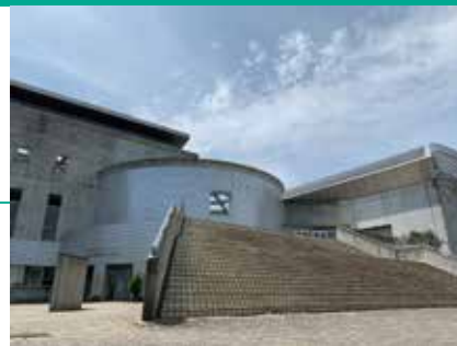
毎日興業アリーナ久喜

毎日興業アリーナ久喜メインアリーナ（第1体育館） 菖蒲保健センター、栗橋保健センター、鷺宮保健センター ※各保健センターの集団接種は6月1日以降の開始予定です。