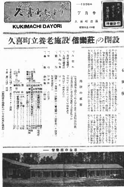
「久喜町だより 昭和 31 年 7 月号」