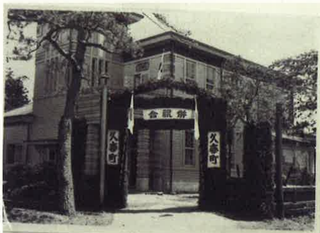
「合併当時の久喜町役場」