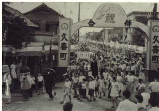
「合併祝賀会の様子」