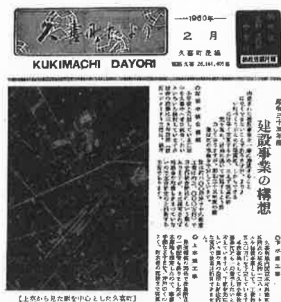
「久喜町だより昭和 35 年 2 月号」

国内の経済成長は目覚しく、昭和 35 年になると戦前の GDP を超え、世界に類を見ない復興を遂げています。オリンピックの誘致に成功してからは、高速道路、東海道新幹線の建設をはじめとするインフラの整備が、日本各地で急即に進められてきました。