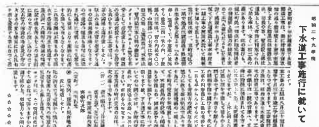
「久喜町だより」昭和 29 年 10 月号

また、当時は、度重なる台風や冷害などが原因で穀物が不足していたことから、国が主要穀物を管理する時期が昭和 30 年まで続いていました。昭和 20 年代という時代は、戦後とはいえ解決しなければならない課題が山積みであったことが、この「久喜町だより」からもうかがうことができます。