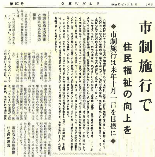
「久喜町だより昭和 45 年 7 月号」

昭和 44(1969)年 3 月の地方自治法が一部改正され、人口規模が 3 万人で市制施行が可能になり、このことは、久喜町の市制施行への動きを加速させることになりました。