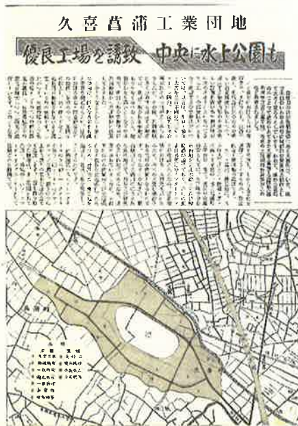
「久喜町だより昭和 45 年 4 月号」

重化学工業化が急激に進んだ高度経済成長から安定期に入ったこの時期、電気、ガス、上下水道といった生活基盤の整備や電話、カラーテレビなどの電化製品が人々の生活の中に浸透してきました。このようななか、久喜町においてもニュータウンや工業産地などの造成が行なわれました。