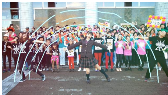
「1000人クッキーダンス」の一コマ

久喜市では、このほかに市の魅力を伝えるものとして公式動画チャンネルを開設し PR ビデオを公開しています。この PR ビデオは、参加した3,058人全員が、クッキーダンスを踊る企画が目を引き、60万回を超える再生回数を記録しています。