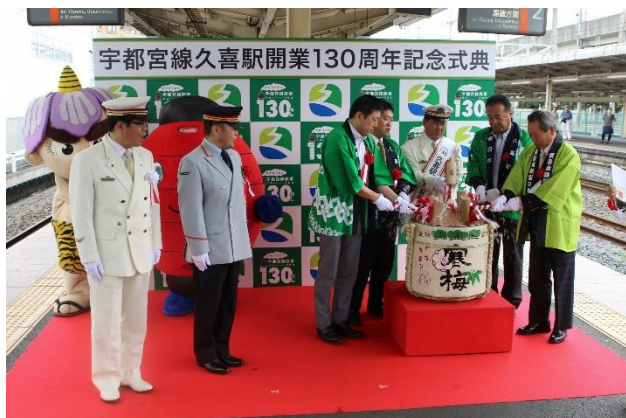
JR宇都宮線 久喜駅開業130年式典 平成27年

明治18年の開業から数えて130年を迎えることを記念して、JR宇都宮線の久喜駅と栗橋駅で記念式典が行われました。