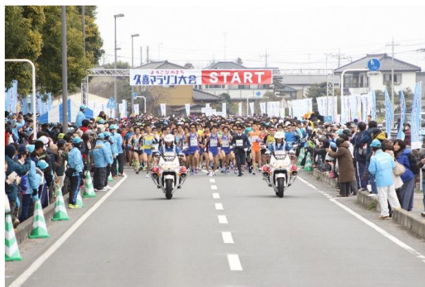
第1回よこびのまち 久喜マラソン大会 平成28年

第1回よこびのまち久喜マラソン大会が、3月13日(日)に開催されました。参加者は、3,454名、当日は、川内優輝さんをゲストランナーに迎え、大会は大いに盛り上がりました。