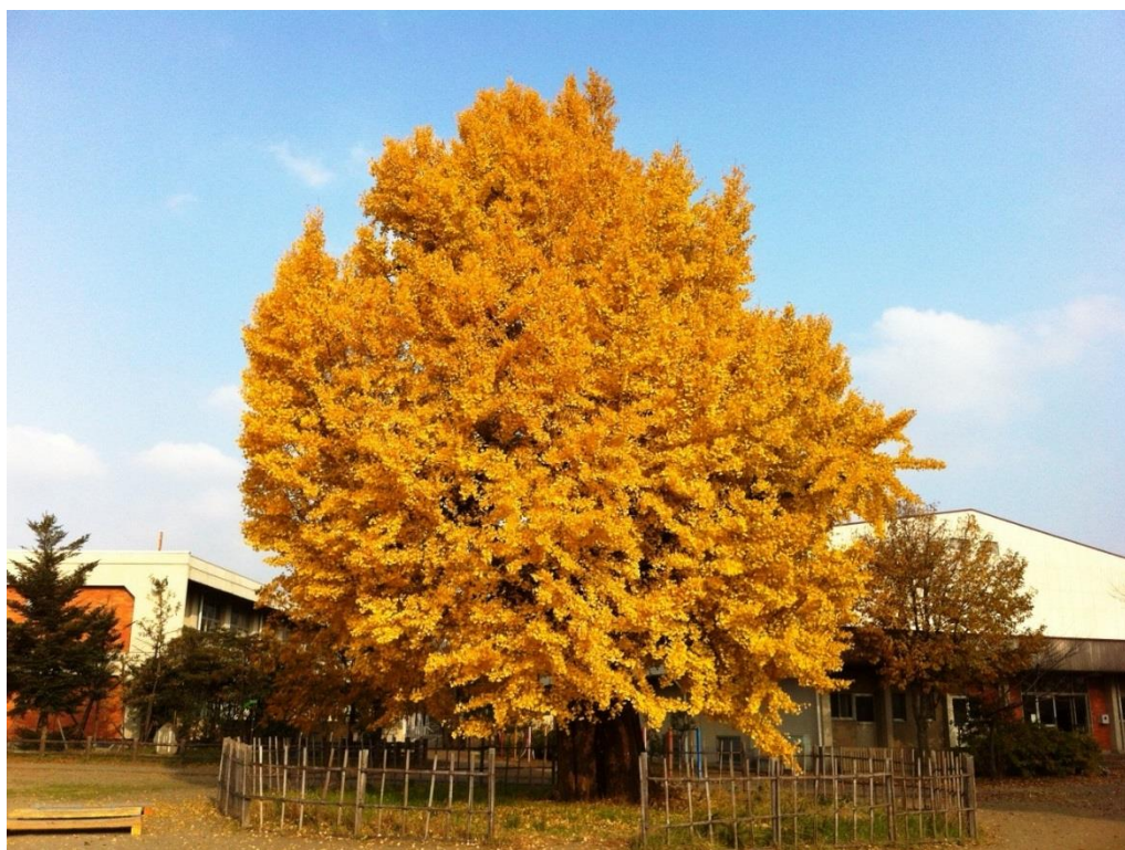
久喜市立三箇小学校の大イチョウ